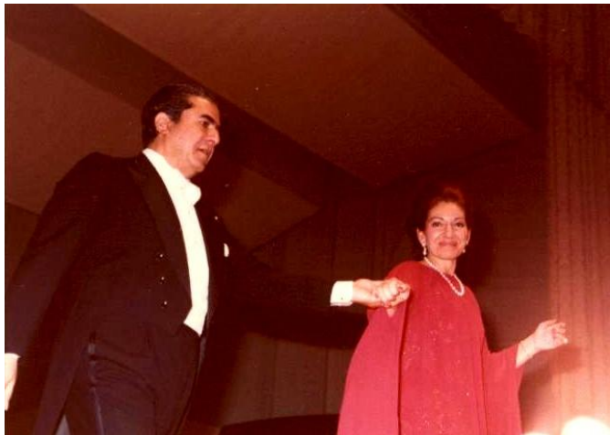
Giuseppe Di Stefano e Maria Callas

Il 10 aprile 1973 dirige, con Maria Callas, I vespri siciliani di Giuseppe Verdi, in occasione dell'inaugurazione del Teatro Regio di Torino ricostruito dopo l'incendio del 1936. Nel 1973 è ancora una volta partner di Maria Callas in una tournée che ha un eccezionale successo di pubblico, ma che si interrompe poi bruscamente a causa di problemi di salute della Callas.